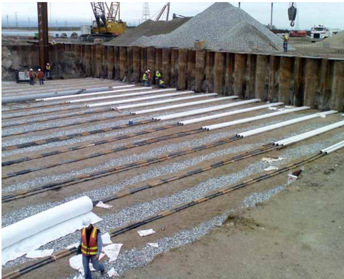
Trvalá táhla pro kotvení nábrežních zdí

Systém protikorozní ochrany je volen podle předpokládané životnosti a podmínek, kterým bude prvek vystaven.