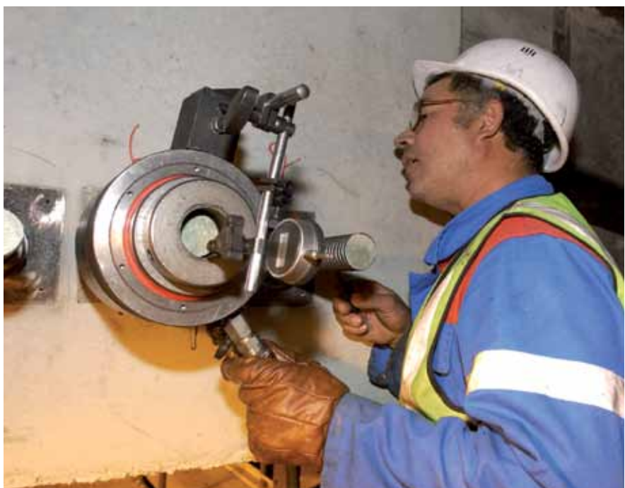
Napínání hydraulickým lisem