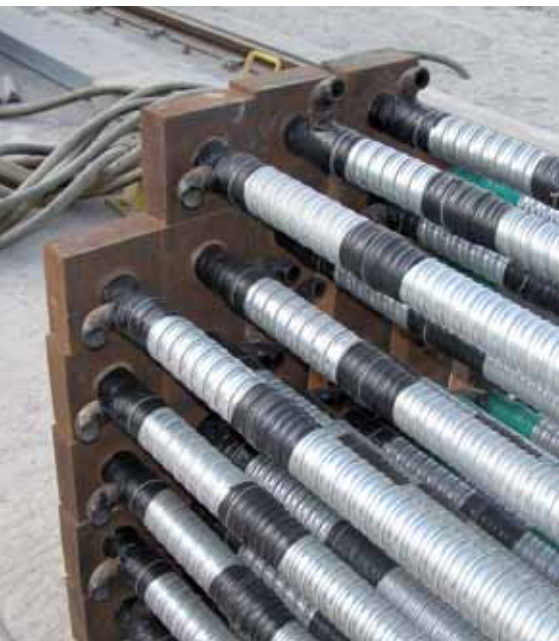
Prefabrikované tyčové předpínací prvky

Systém kontroly kvality výroby předpínacích tyčí a kotevního příslušenství je zaveden a udržován v souladu s normou ISO 9000:2000. Kotvy a tyče jsou úspěšně testovány dle požadavků ETAG 013.