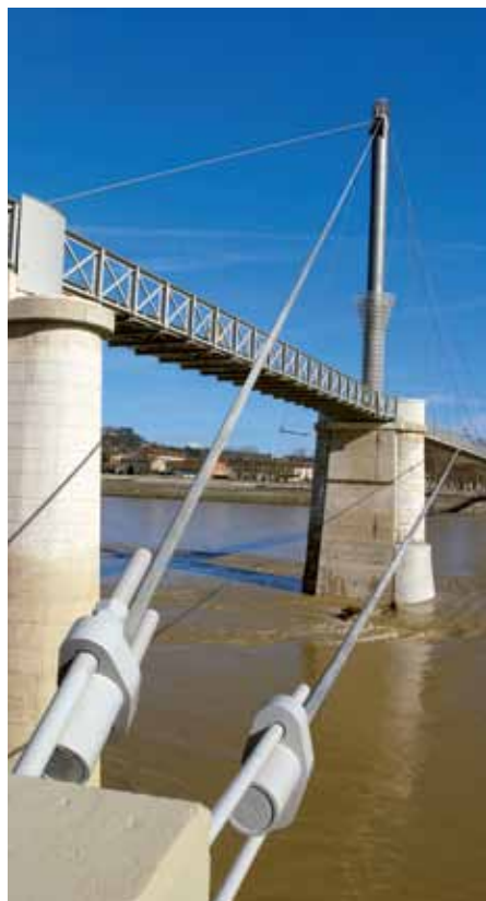
Kotvení ocelových lan